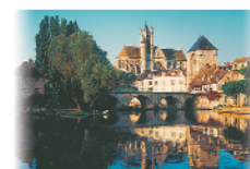
10 - Moret-sur-Loing