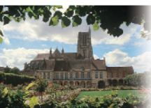
1 - Meaux