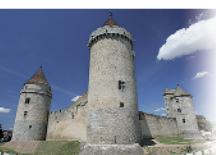
4 - Blandy les Tours