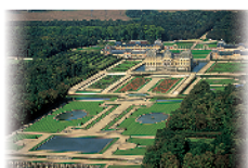
6 - Vaux-le-Vicomte