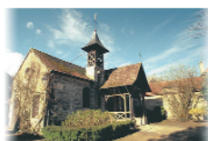
8 - Barbizon