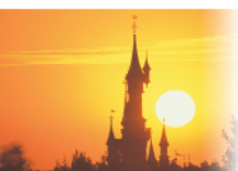
2 - Disneyland® Resort Paris