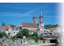
5 - Melun