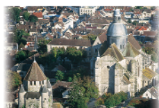
7 - Provins