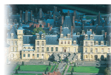
9 - Fontainebleau