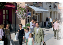
2 - La Vallée Village